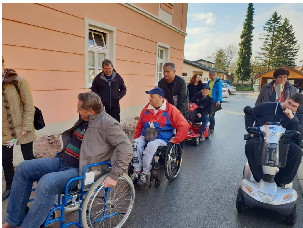
Koordinativna seja vseh organizacij, sprejem pri županu