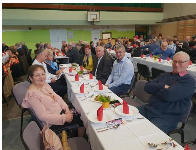
Vsakoletno srečanje invalidov in upokojencev ob Štefanovem, 26. 12. 2019

Društvo invalidov Muta skrbi za osveščanje članov in občanov o potrebah invalidov, starejših in bolnih članov ter oseb s posebnimi potrebami na območju občine Muta. Društvo redno informira vse svoje člane o aktivnostih, prireja dogodke in je aktivno vpeto v vse plasti lokalne skupnosti.